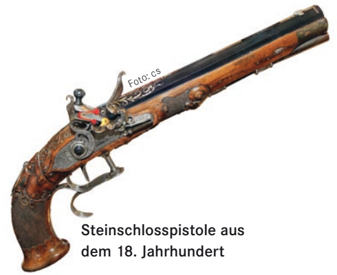
Steinschlosspistole aus dem 18. Jahrhundert

Im Stadtmuseum des sächsischen Örtchens Oederan werden seit dem 19. März Kunstwerke und Jagdwaffen präsentiert, die vor allem bei Jägern für glänzende Augen sorgen dürften. unsere Jagd war für Sie bei der Eröffnung der Ausstellung dabei.